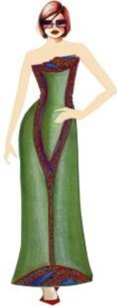
شكل " ٢٥ " فستان طويل من تصميم الدراسة مستلهم من التراث النوبي