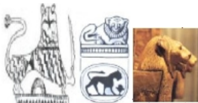
شكل "٦" الأسد في التراث النوبي

٢- الأسد : مصدره الأساسي من الطراز المصري القديم والحضارة الأشورية وهو رمز القوة والبسالة والإقدام والشجاعة وتم تناولة بعدة هيئات في الزخارف النوبية وكرسوم على الأثاث والأقمشة ومن المؤثرات التي أدت الى وجوده في التراث الشعبي النوبي هي البيئة الإجتماعية فقد عبرت القصص والسير الشعبية القديمة والتي تحكى عظمة وبسالة الأجداد بالأسد كرمز للشجاعة والإقدام والبطولة والقوة " ابتسام محمد عبد الوهاب - ٢٠١٤ " , كما هو في شكل "٦".