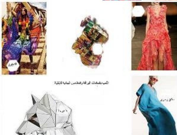
شكل "١٧" الانفجار " Explosion "