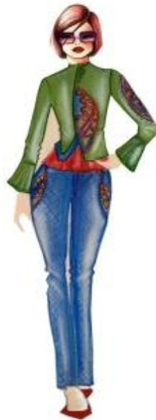
شكل " ٢٤ " جاكيت وبلوزه وبنطلون طويل من تصميم الدراسة مستلهم من التراث النوبي