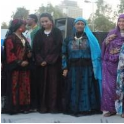
شكل " ١٦ " الجرجار النوبي