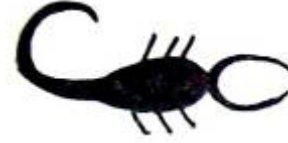
شكل "٧" العقرب في التراث النوبي

٣- العقرب : رسم العقرب إتقاء لشره و التزود بالقوة و الإحساس بإمكانية التغلب و السيطرة عليه , كما هو موضح في شكل "٧" . " احمد سمير – ٢٠١٣ ."