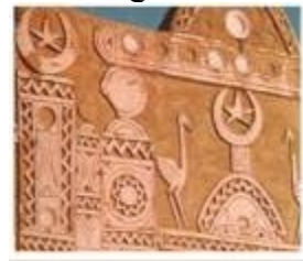
شكل "١٠" شكل الهلال والنجمة في التراث النوبي

١- الهلال والنجمة : من أهم الرموز النوبية وهما في الأصل رمزان إسلاميان يدلان على التفاؤل، فالمسلمون ينتظرون هلال أول الشهر و يحددون أوقات أعيادهم على أساس هلال القمر.والنجوم البراقة ليلا على صفحة السماء المثمنة او الخماسية ، فالنجمه والهلال تعبر عن التأثير الإسلامي على التراث النوبي ، كما هو موضح في شكل "١٠" .