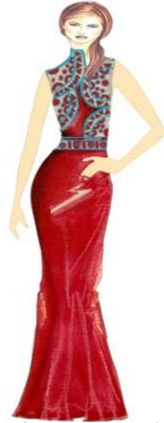
شكل " ٢١ " فستان طويل من تصميم الدارسة مستلهم من التراث النوبي

الألوان : تم إستخدام اللون الأحمر والأخضر والأزرق وهي ألوان ذو دلالات في التراث النوبي فاللون الأحمر يدل على البهجة. واللون الأخضر مصدره يدل على الخير وتم تناولة في الأماكن الدينية وتعبيرا عن الخير. واللون الأزرق رمز للوفرة والكرم حيث كان النيل العظيم يمثل لأهالي النوبة منذ عهد الفراعنة وكذلك هي ألوان من إتجاهات الموضحة لصيف ٢٠١٧ كما تم عرضه من قبل .