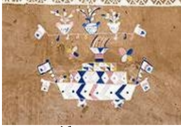
شكل "١٢" شكل السفينة في التراث النوبي

٣- السفينة : تمثل السفن مكانه خاصة لدى النوبيين ، ففي وصوله خير وبشرى لهم حيث كانت تحمل خطابات من النوبيين المهاجرين والهدايا والمال ، كما استخدمت المراكب الشراعية في التنقل بين القرى النوبية الواقعة على جانبي النيل كما هو موضح في الشكل "١٢" .