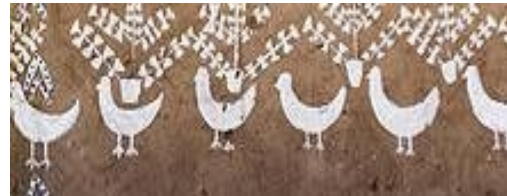
شكل "٩" شكل الطيور في التراث النوبي

١- الطيور : إعتنت المرأة النوبية بتربية الطيور و إعتبرتها مصدر للخير ويعد "الحمام" القوه الحارسة الكبرى في معتقدات النوبيين وهي ترمز للسلام ، كما هو موضح في شكل "٩"