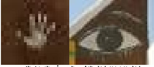
شكل "١١" شكل الكف والعين في التراث النوبي

" , فإستخدام الكف المطبوع والممزوج بالدماء للوقاية من الحسد وهو يماثل كف الوقاية عند المصريين القدماء , كما هو في شكل "١١" . اشرف حسين ابراهيم – ٢٠١٣ ."