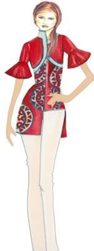
شكل " ٢٢ " بلوزة وبنطلون من تصميم الدارسة مستلهم من التراث النوبي

الجانب الوظيفي : تتميز هذه التصميمات بالعديد من الوظائف فقد يتم إرتداؤها في فترة الصباح أو في فترة المساء