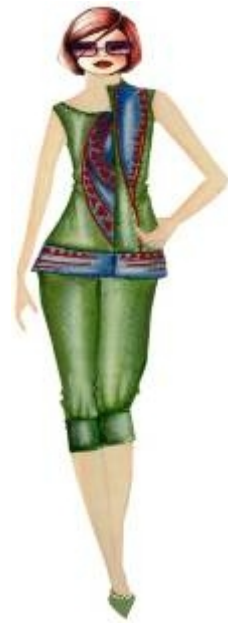
شكل " ٢٣ " بلوزة وبنطلون من تصميم الدراسة مستلهم من التراث النوبي

للتراث النوبي حيث الدائرة والمثلث في وحدات تتلائم مع موضة صيف ٢٠١٧ .