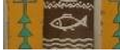
شكل "٨" شكل السمكة في التراث النوبي

٥- السمكة : السمكة رمز التكاثر ، وتعنى الخير والعيش الرغد وجد في الأساطير الفرعونية و نراه في التراث النوبي ، كما هو موضح في شكل "٨" .