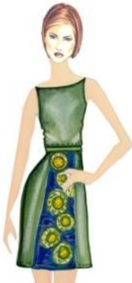
شكل " ٢٧ " فستان قصير من تصميم الدراسة مستلهم من التراث النوبي