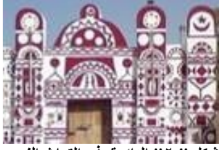
شكل "٢" الدائرة في التراث النوبي

طوافه حول الكعبة فالدائرة تعبر عن القدسية , كما هو موضح بالشكل "٣".