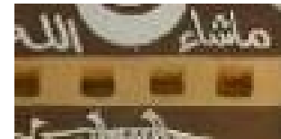
شكل "٢" المربع في التراث النوبي

١- المربع : يمثل المربع علاقات متوازنة حول نقطة المركز ، فنجد الكعبة "البيت المقدس " بنيت على أساس مربع فهو يمثل التوازن والقدسية , " وأستخدم لجلب الحظ , كما هو موضح بالشكل "٢".