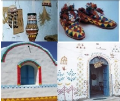
شكل "١٣" الألوان التي إستخدمها النوبيون ولها جذور إسلاميه ومصرية قديمة

اللون في البيئة النوبية بصفة عامة يعبر عن الطابع الفطري الواضح للإنسان النوبي البسيط الذي يبهرة كل ماحولة من ألوان طبيعية نابعة من عناصر البيئة المحيطة به ، ومن تلك الألوان الأحمر والأصفر والبرتقالي والأخضر والأزرق وكلها ألوان قوية وصريحة تعبر عن صدق الشخصية النوبية " ، وشكل " ١٣ " ، " ١٤ " " مها محمود ابراهيم – ٢٠١٣ ."