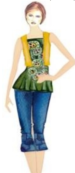
شكل " ٢٦ " فيست وبلوزه وبنطلون من تصميم الدراسة مستلهم من التراث النوبي